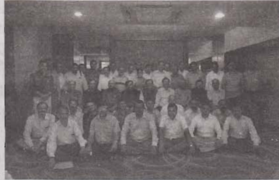
કારોબારી મંડળના સભ્યો