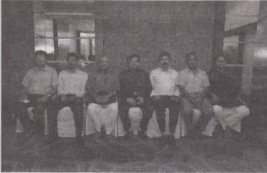
તંત્રી મંડળના સભ્યો