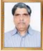
જયંત જી. જોષી મંત્રી